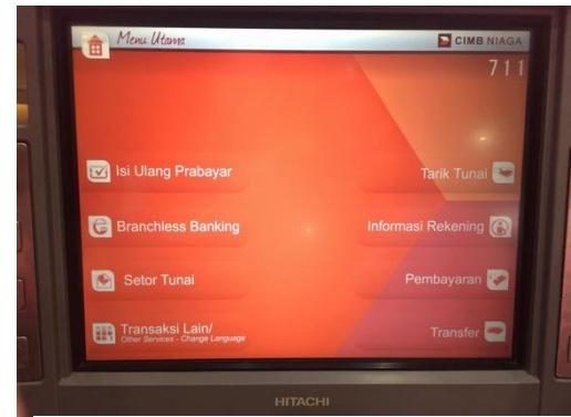
Step 2 : Pilih menu TRANSFER .