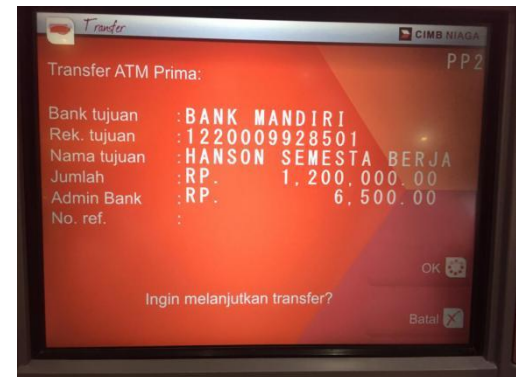
Step 7 : Periksa kembali detailnya lalu tekan OK untuk melakukan transfer.