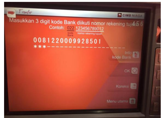
Step 4 : Masukkan Kode Bank Mandiri (008) dan No. Rekening Bank Mandiri a/n PT Hanson Semesta Berjangka (122-000-992-8501).