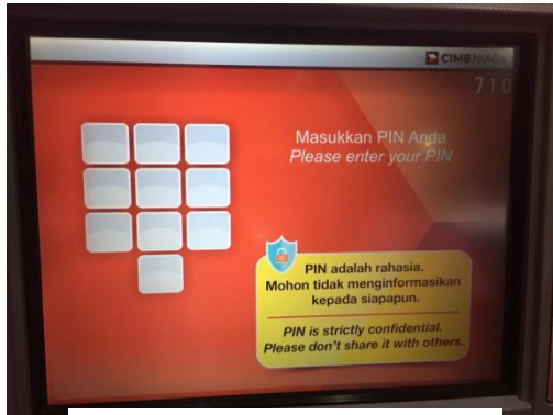
Step 1 : Masukkan PIN.